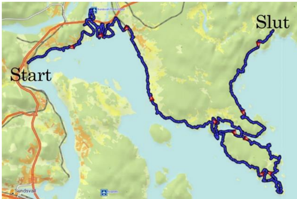
Figur 1: Kartbild över den tänkta sträckningen

Besöksnäringssprogram: I juni 2018 beslutade kommunstyrelsen att uppdra till Näringslivskontoret att ta fram ett förslag på besöksnäringssprogram för Timrå kommun. Beslutet var en del i antagandet av "Policy för Näringslivsutveckling – Strategi för Norrlands bästa företagsklimat". I denna pekade Besöksnäring ut som ett viktigt område att utveckla för att stärka Timrå kommuns och regionens attraktionskraft. Med den grunden såg vi förutsättningar för att utveckla en kustnära besöksnäringssatsning som går i samklang med kommunens framtida inriktning.