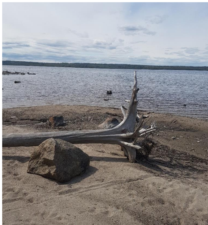
Bild 5: Drivved på stranden efter den tänkta vandringsleden