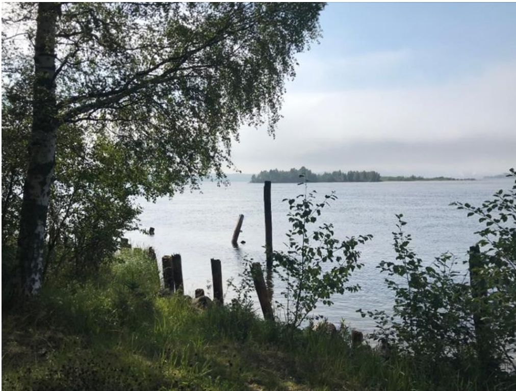
Bild 1: Grönudden med rester från flottningsepoken, efter etapp 1

Vårt projekt började som en ren förstudie för att se om vi kan nå fram till vår framtidsvision på längre sikt. Vår inriktning är att jobba för hållbar turism under planering och etablering av leden. I begreppet vandringsled har vi valt att fokusera på att i första hand skapa förutsättningar för en enkel mansbred stig som är tillräckligt bra. Utgångspunkten är att leden/stigen ska göra minimal påverkan i terrängen och för de boende i närområdet och att den sker i samverkan med markägare och lokalboende. Vi vill i förstudien slå fast minikrav på bl a tillgänglighetsnivå för vandrare i form av guidelines. Det är viktigt att alla kan hitta och känna sig säkra under sin vandring. För att förstärka upplevelsen och vägleda besökaren vill vi att den framtida leden skall beskriva besöksmål, historia och andra upplevelser efter vandringsleden. Det är också viktigt att lyfta fram boende, aktiviteter och mat efter sträckan för att främja lokala besöksnäringssidkare och näringen som helhet.