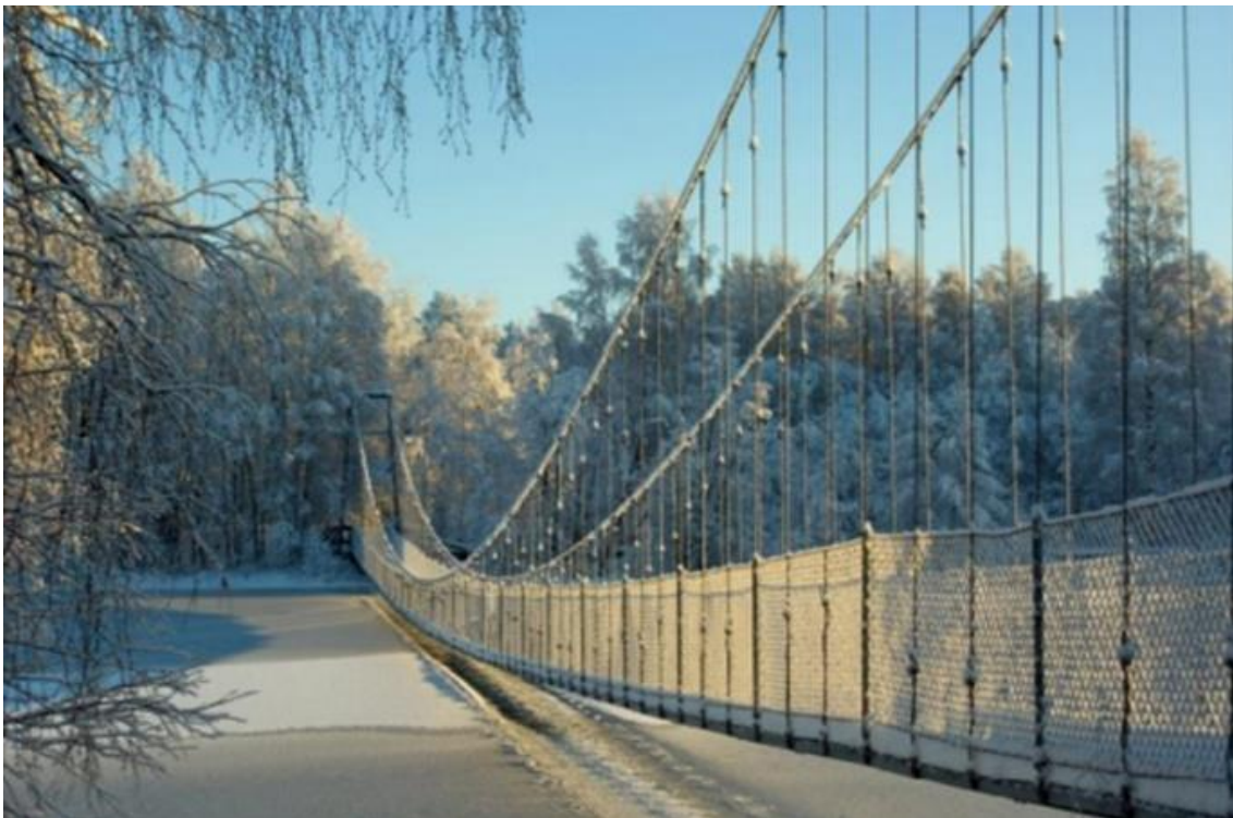
Bild 4: Vinterbild över hängbro i Deltats naturreservat – etapp 1

Vår slutsats efter förstudien är att Timrå Kustvandring definitivt är möjlig att genomföra och den skulle tillföra mycket för vårt område både för Timrå kommun, boende och för besökare. Det är dock mycket som måste tas hänsyn till och det är olika på olika etapper varför vi framförallt tror på att genomföra den etappvis och i en enklare form som ett första steg. I framtiden när leden har etablerats kan man utveckla den ytterligare och göra den ännu mer lättillgänglig.